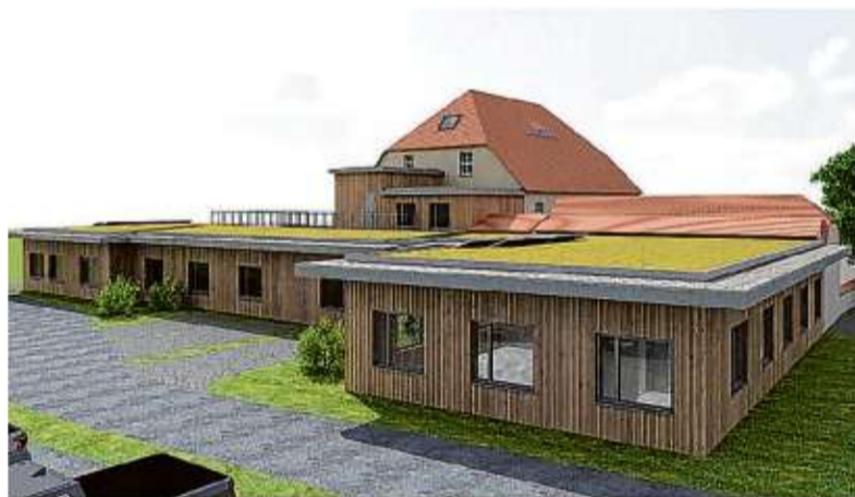
Seitlich von Amtshaus und Bürgerbüro soll sich das „Kommunales Dienstleistungszentrum“ anschließen.

Über die Projekte wird am 16. Juli entschieden. Schlieben möchte den Hort (4,7 Millionen Euro) vorzeitig angehen. Die Abstimmungen mit dem Ministerium laufen. Der Kita-Bau, der an den Schulcampus grenzt, kostet etwa 6,3 Millionen Euro. Die Förderung beträgt 90 bzw. 95 Prozent. ru