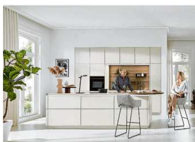
Modern und gemütlich wirkt diese grifflose Küchen- und Wohnlandschaft mit ihrem minimalistisch-klaren Design und den feinen, schmalen Rahmenfronten.

anderen warmen Farbtönen. Ähnlich verhält es sich mit der Trendfarbe Greige, einer ausgewogenen Komposition von warmen Beige- und Grautönen. Greige wirkt ebenso zeitlos wie Beige. Ton-in-Ton und in Kombination mit angesagten Steindekoren wie Marmor und Granit mutet Greige geradezu distinguiert an. Exklusive Lamellenfronten, wie sie bislang dem gehobenen Preissegment vorbehalten waren, sind nun auch im Preiseinstiegsbereich als Holzdekor-Front zu haben. Die Premium-Küchenmöbelhersteller favorisieren in der neuen Saison einen lässigen Japandi-Stil, den reizvollen Mix aus japanischer Klarheit und Reduktion auf das Wesentliche und skandinavischer Gemütlichkeit und Natürlichkeit. Diese hochwertigen Küchen zeichnen sich in der Gestaltung durch eine wohlthuende Ruhe und